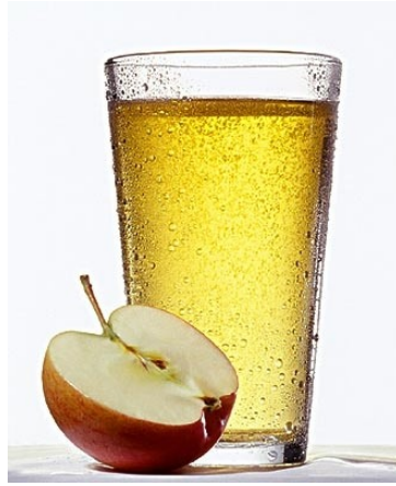
píng guǒ zhī