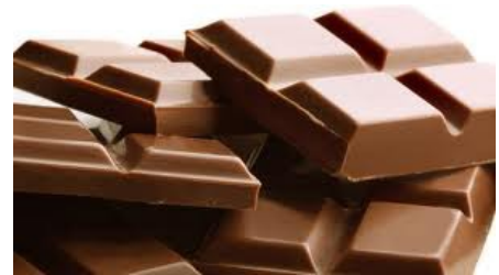
qiǎo kè lì