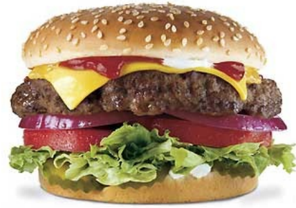
hàn bǎo bāo