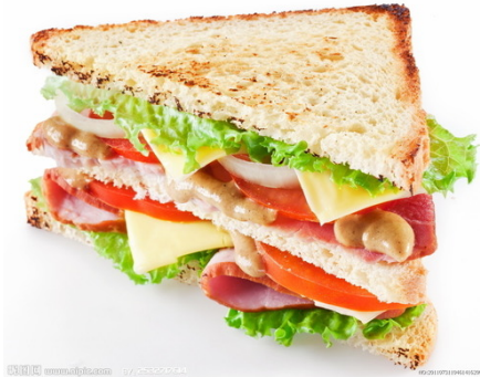
sān míng zhì