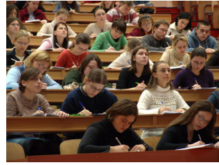
dà xué shēng