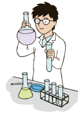
kē xué jiā