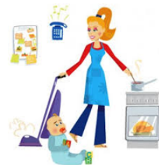
jiā tíng zhǔ fù