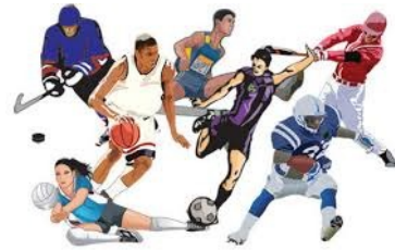
yùn dòng yuán