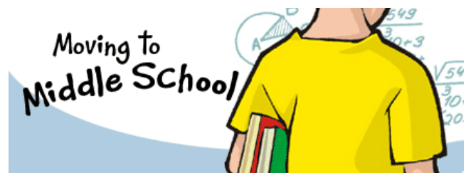
zhōng xué shēng