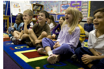
xiǎo xué shēng