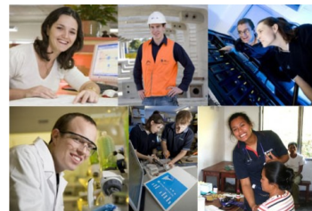
Nǐ de gōngzuò shì shénme?