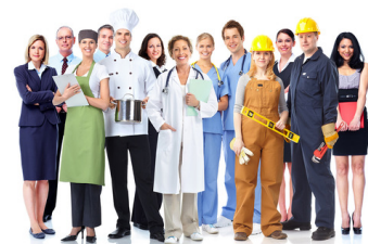
wǒ de gōngzuò shì...