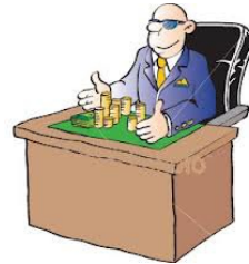
yín háng jiā